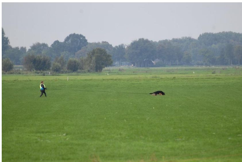
Wendy Hendriks met Boyd

Bij aankomst in Oldebroek, werd er eerst geloot, waarna er vertrokken werd naar de speurvelden. Deze waren van verassend goede kwaliteit, gezien dat er een lange, warme en droge periode vooraf gegaan was aan deze dag. De resultaten mochten er dan ook zijn: vier keer een uitmuntend, 3 keer een zeer goed en helaas was er een combinatie gezakt. Bennie Wenting scoorde de hoogste punten met zijn hond: 98!