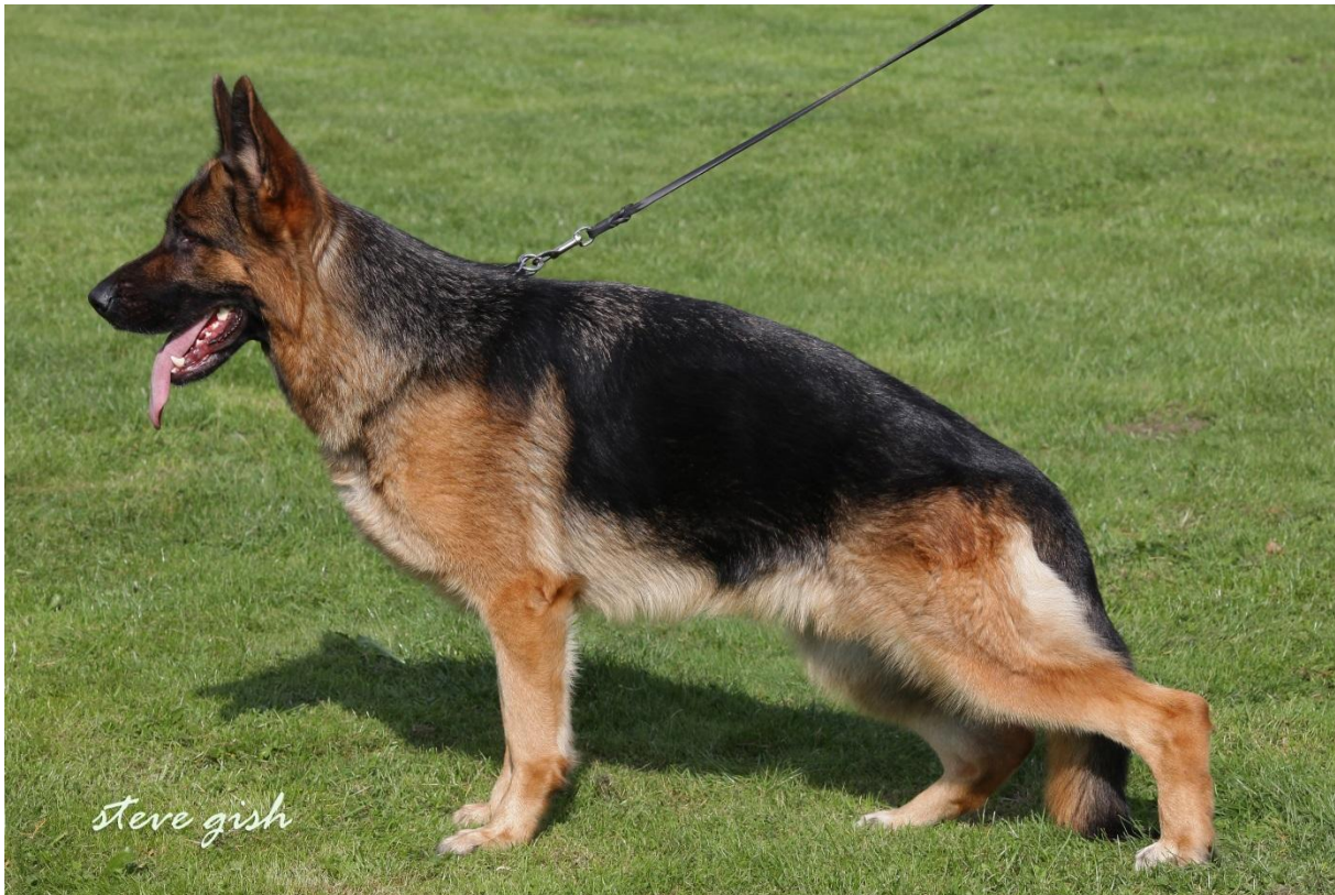
Ellis v.d. Modderbeek IP0 1 Kkl.